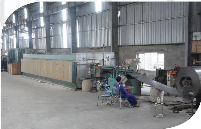
Hệ thống máy ủ