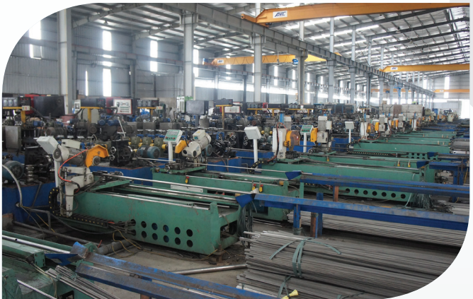
Hệ thống máy lốc ống, hộp